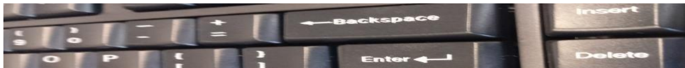
Ilustracja 2. Wykadrowanie obrazu klawiatura.jpg